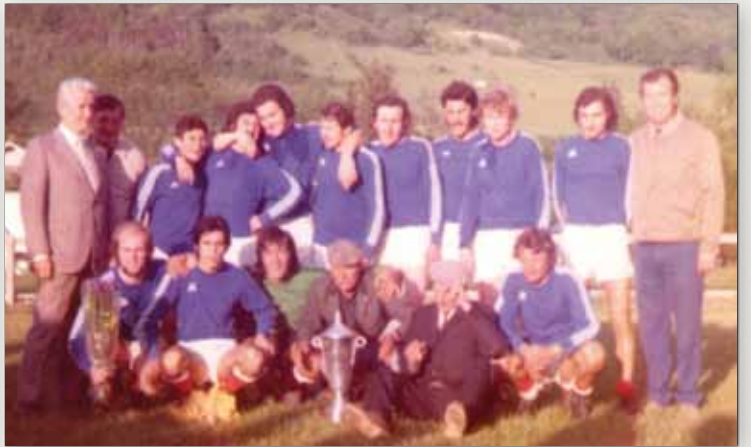
Les Seniors du FCCB remportent la Coupe de l'Isère en 1974