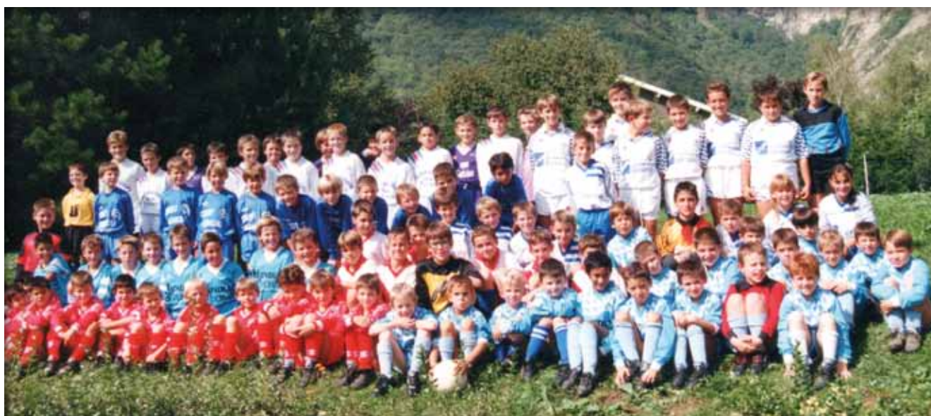
1994 Ecole de Foot

2 titres de Champions de l'Isère en Poussins cette saison qui font suite au titre en Cadets Promotion la saison précédente qui prouvent que la formation au FCCB fonctionne bien.