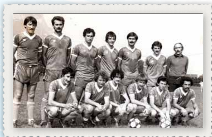
1984 L'équipe Fanion