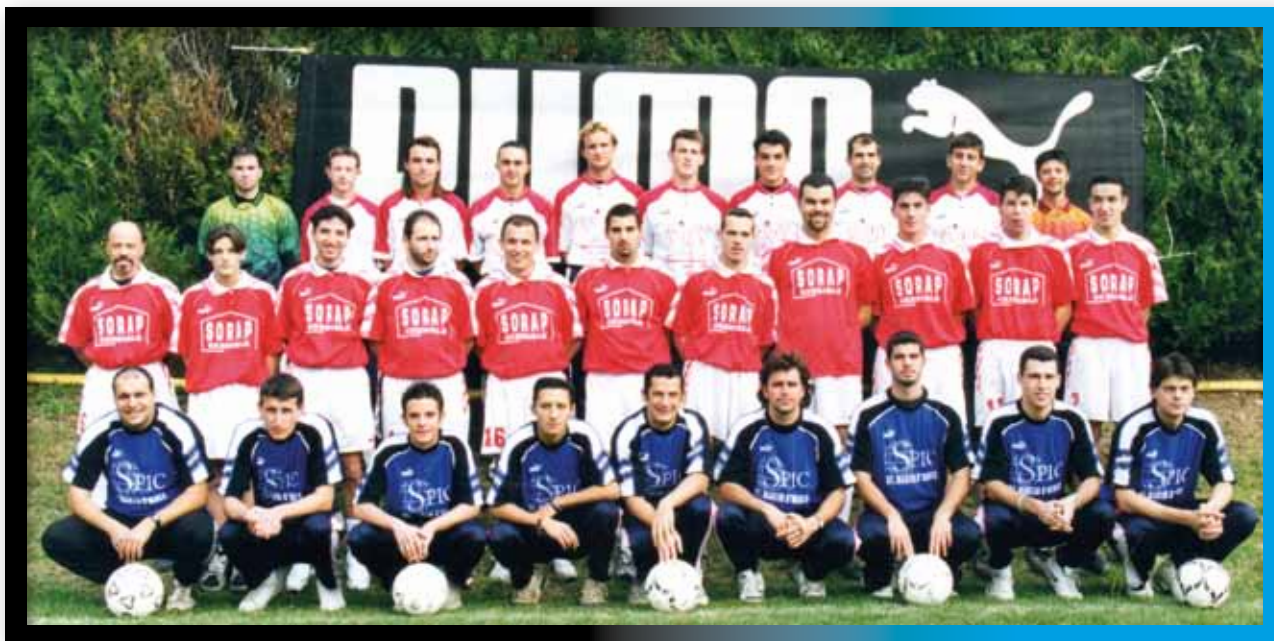
Le Groupe Seniors 1999