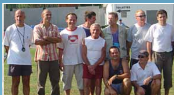
2004 - Challenge Dibartolomeo