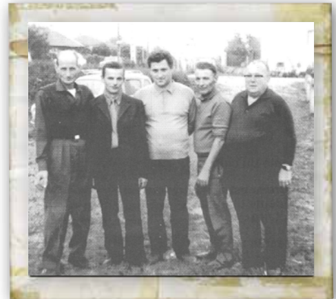
Les Piliers du FCCB dans les années 60