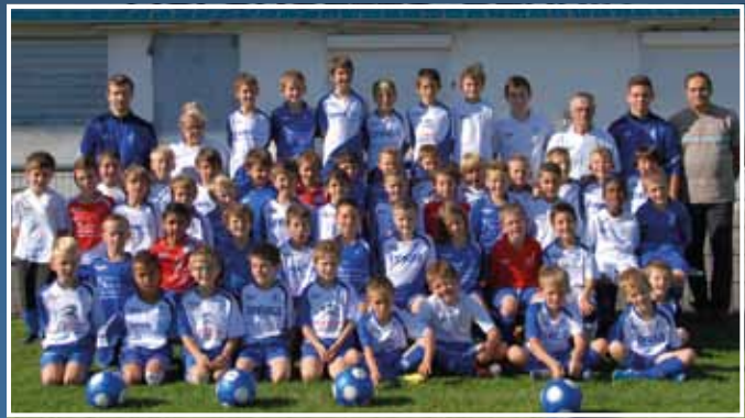
Groupe U8 et U9a