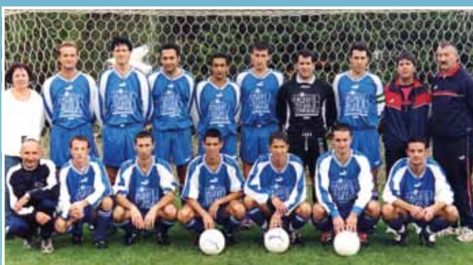
2001 - Equipe Fanion