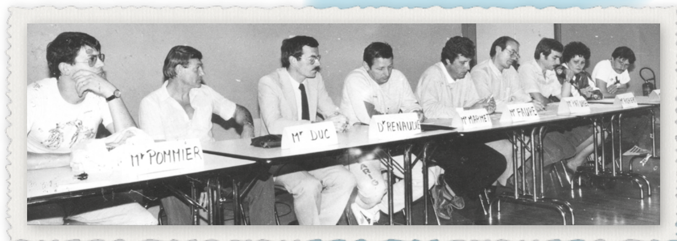
1985 Le bureau lors d'une Assemblée Générale.

Le dévouement des dirigeants qui contribuèrent à bâtir l'édifice du club était reconnu et récompensé par les différentes instances.