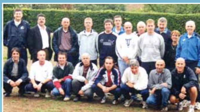
2003 - Bureau