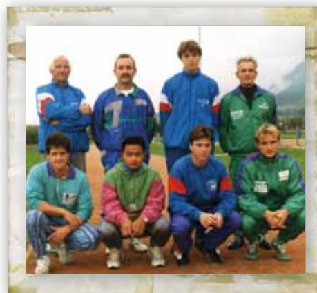
Saison 1991/1992 Les éducateurs débutants, poussins, pupilles