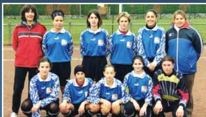
2003 - Feminines 2