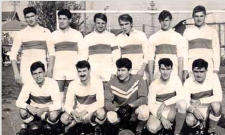
Équipe Fanion saison 1965/66