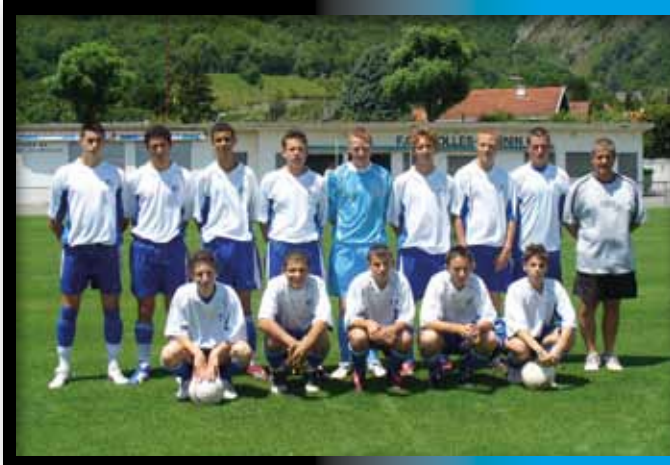
2007 Equipe des 15 ans