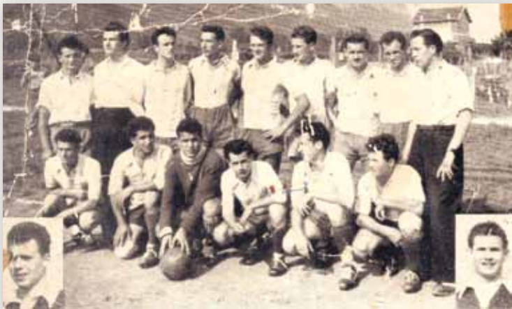
1950 - L'équipe

Le Marais / 38530 Pontcharra www.crealp-environnement.com