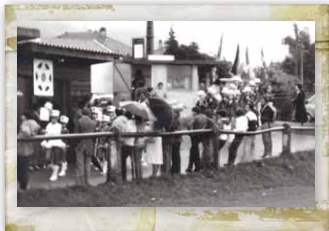
Les Majorettes étaient présentes lors des différents événements organisés par le FCCB.