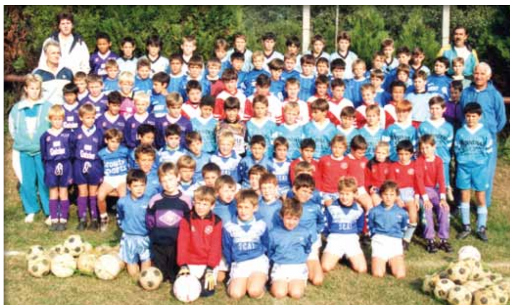
1991 Ecole de Foot