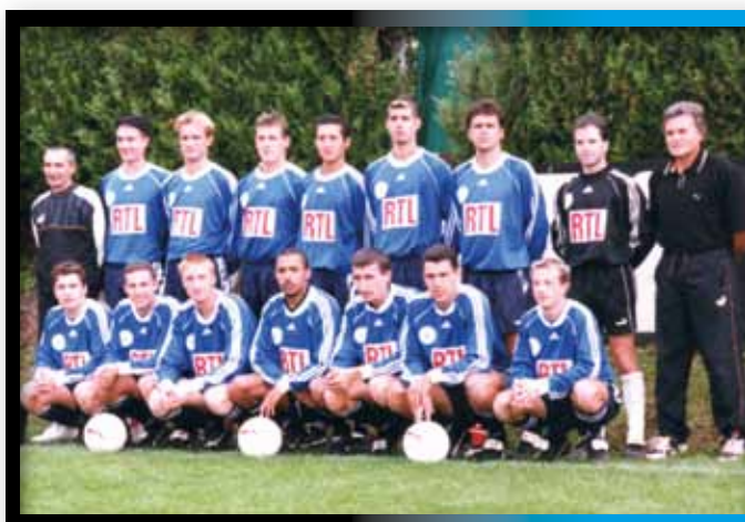
1998 Equipe Fanion