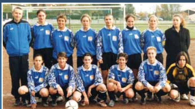
2003 - Feminines 1

Place à la fête pour souffler dignement ses 70 bougies... »