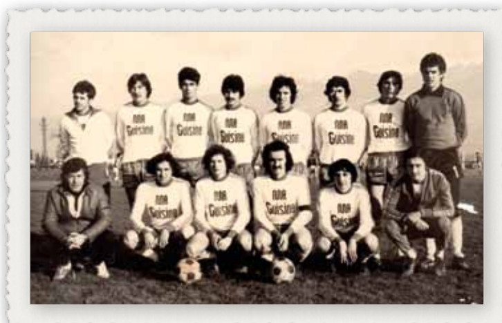
L'équipe Fanion du FCCB en 1978, renforcée par plusieurs juniors