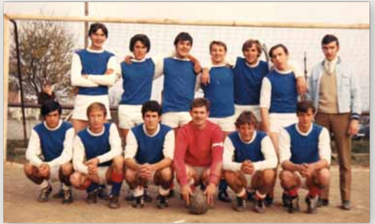
Équipe Seniors 1969

Les Buissonneys - Chemin du Pont de Fer 38920 Crolles - 04 76 08 14 35 / 06 62 52 32 87 contact@fermedantan.fr - http://fermedantan.fr