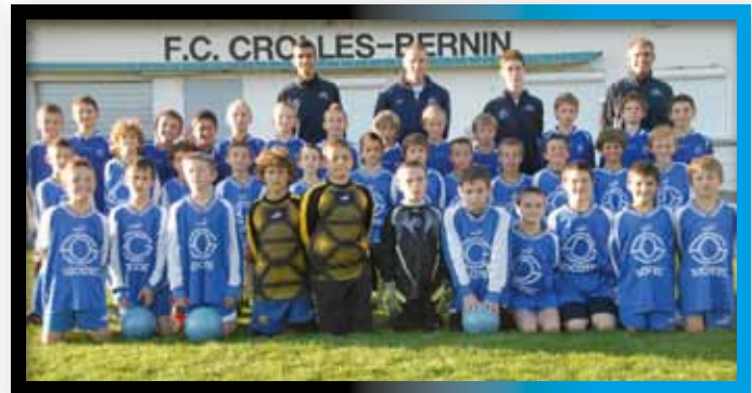
2010 Groupe U11