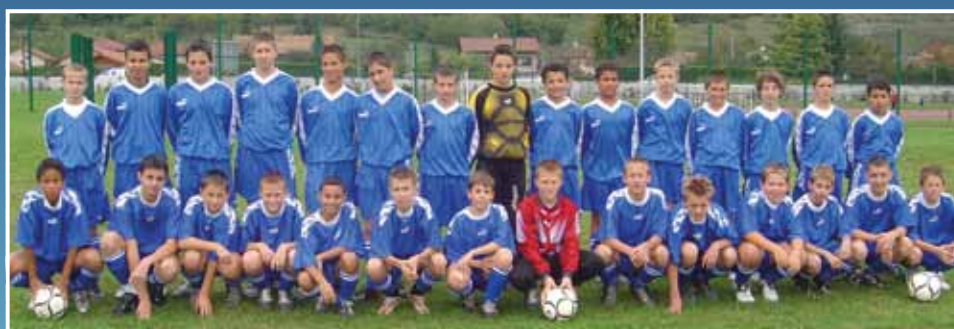
2004 - Equipe 13 ans