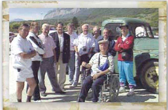
Joueurs du FCCB rassemblés autour du camion Gabert, lors du 50 ème anniversaire du club.