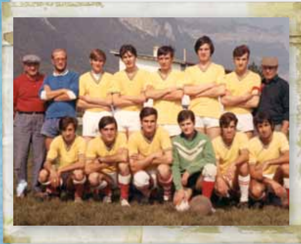
Équipe Seniors B 1971