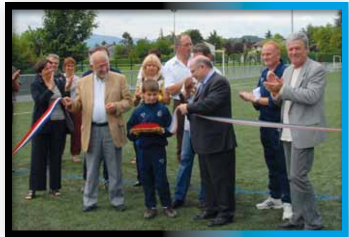
2008 Inauguration du stade synthétique par le député F. BROTTE