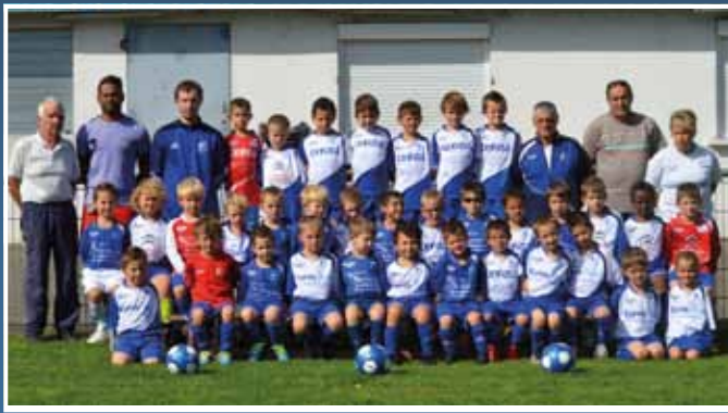
Groupe U6 et U7