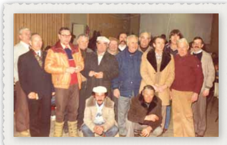
1980 Les anciens sont toujours présents ou invités aux diverses manifestations du club ou assemblées générales...