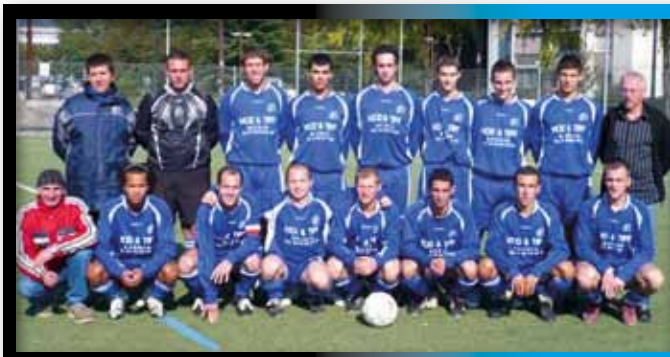
2008 Seniors 1