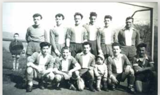
1955 - L'équipe

Rendre à la nature plus que ce qu'elle nous donne.