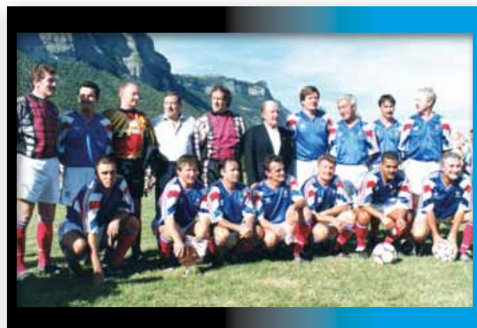
1995 Les Anciens Internationaux de France à Crolles lors du 50 ème Anniversaire du FCCB