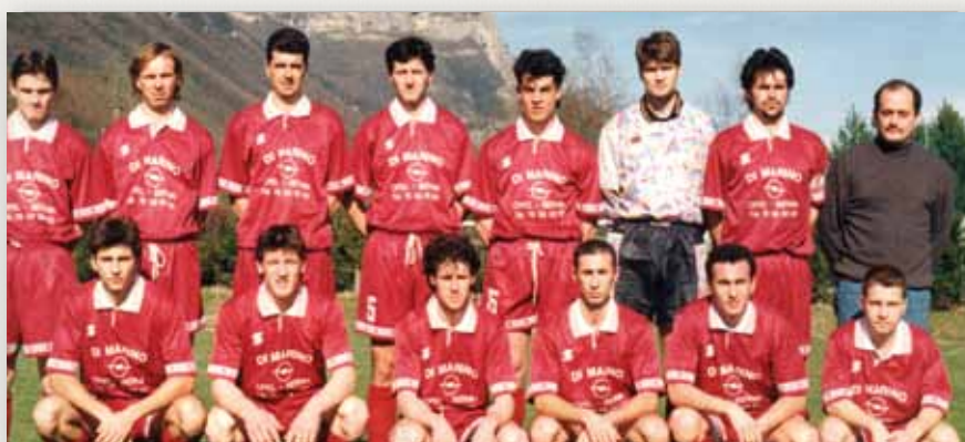
Equipe Fanion 1995