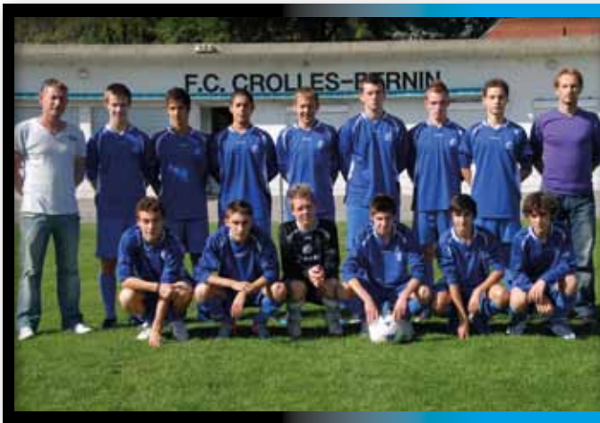
2010 Groupe U17