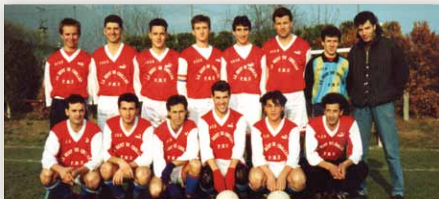
1991 Equipe Fanion