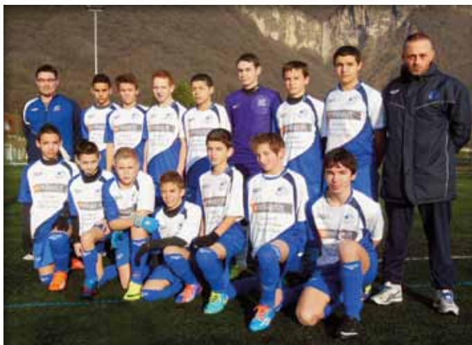
Le symbole de ce bon travail de formation et la fierté du FCCB d'aujourd'hui : L'équipe U15 saison 2013/2014 qui accède en Ligue Rhône Alpes au terme d'une belle saison...

Les résultats sportifs sont bien sûr des objectifs majeurs du club mais la qualité de l'encadrement est prioritaire pour apporter des bases solides éducatives et sportives à tous nos jeunes.